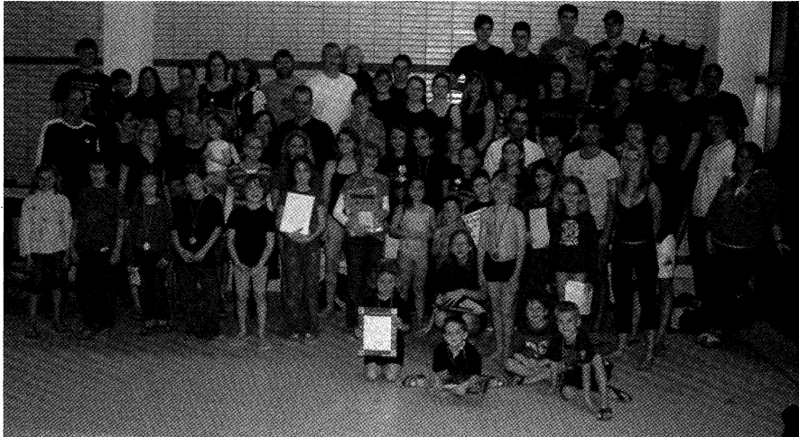
Alle erfolgreichen Teilnehmer bei den Schwimmvereinsmeisterschaften